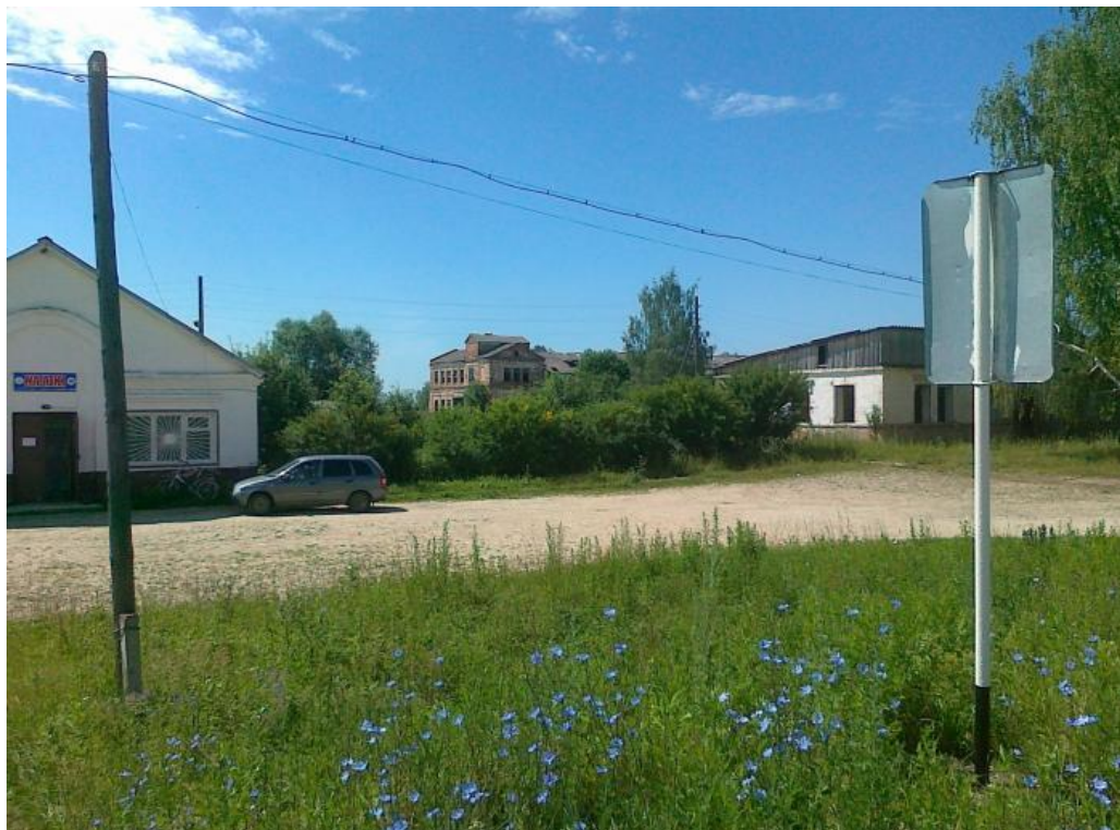
Фото 6,7. Виды на село Алексеиха - центральную усадьбу совхоза.