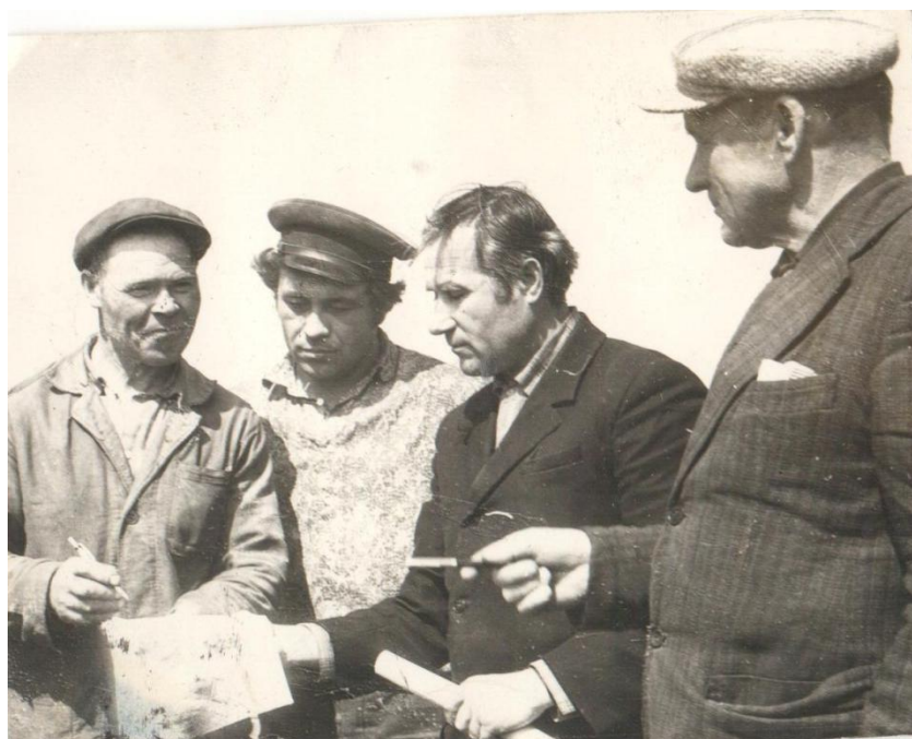
Фото 4. Механизаторы с-за Алексеевский подписывают обращение к механизаторам колхозов района для участия в соцсоревновании.