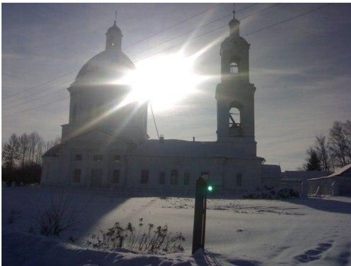
Фото 4. Солнце встало. Вознесенская церковь.

(Отпускъ въ дѣльгъ Вятск. Духови. Консист. 1815 г. № 84)».