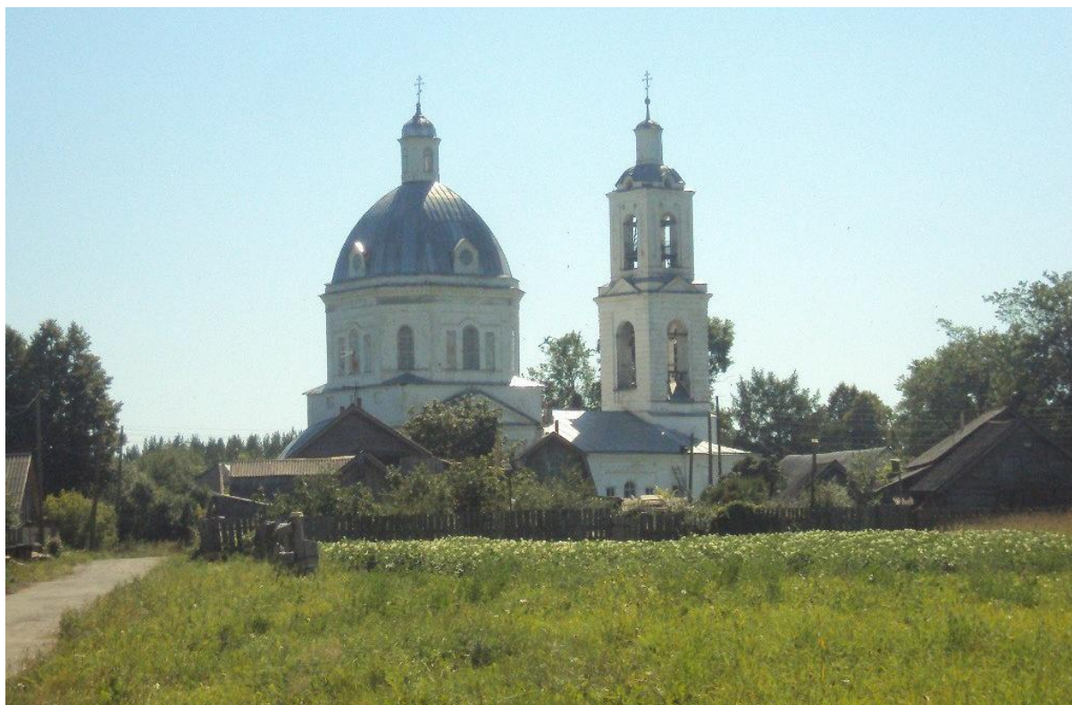
Фото 3. Село Сметанино. Вознесенская церковь. Июль.