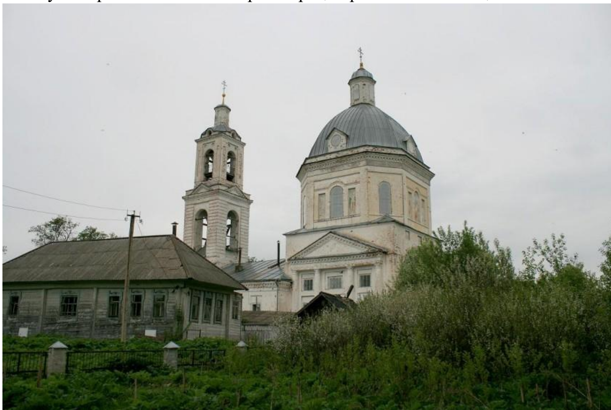
Фото 5. Незыблемый храм – Вознесенская церковь.

Так власти Санчурского района трижды пытались закрыть Вознесенскую церковь с.Сметанино: первый раз - в сентябре 1961 г. по предложению механизаторов колхоза «Новая жизнь», второй раз – в апреле 1963 г. – по инициативе работников местного детского дома, третий раз – в апреле 1964 г., когда церковь осталась без священника, вышедшего по старости за штат епархии , но каждый раз Совет по делам Русской Православной Церкви не находил оснований для снятия с регистрации Сметанинской общины, «учитывая высокую активность этого религиозного общества». 3 Дважды – в июле 1963 г. и апреле 1964 г. – Совет по делам Русской Православной Церкви отказывал Кировскому сельскому облисполкому в закрытии Покровской церкви г.Советска, обращая внимание уполномоченного И.Д.Ляпина на «несерьезное отношение к представлению Совету материалов на снятие с регистрации религиозных обществ».