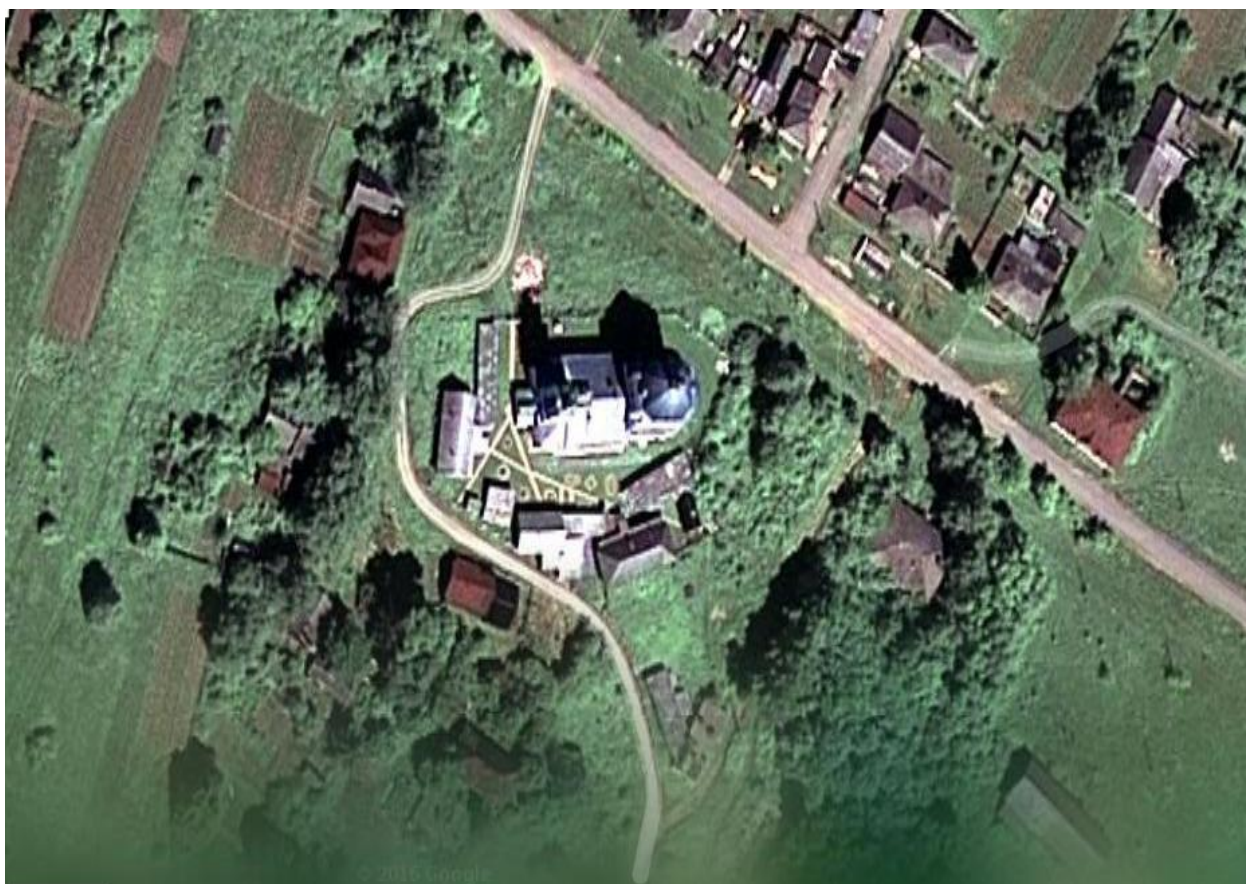
Фото 2. Вознесенская церковь. Вид из космоса.

В книге «Вятская епархия. Историко-географическое и статистическое описание. Вятка, 1912 г.» написано: «Бывшая в селе Вознесенская церковь каменная, построена в 1826 г. расстоянием от гор. Вятки 288 верст, от г. Яранска в 60 верстах. На приходском кладбище часовня деревянная, построена в 1871 г.. Причта по штату положено: 1 священник, 1 диакон, 1 псаломщик; квартиры для причта казенные, кроме священника Махнева, который имеет свой дом. Земли: усадебной и под площадью 3 десятины, пахотной 33 десятины, сенокосной около 3 десятин, пахотную землю пользуются крестьяне...».