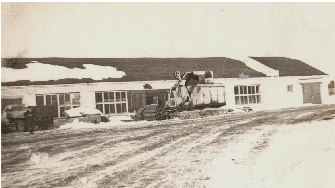
Фото 6. Машинно-тракторный гараж, д.Колотово.