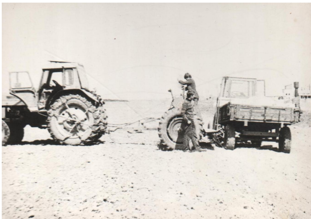
Фото 12, 13. От лошади к «железному коню». Посевная кампания в разгаре (вверху).