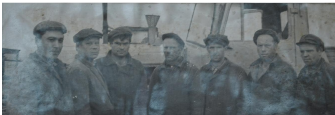
Фото 7. Звено механизаторов, д.Колотово. Вторая бригада колхоза им.Н.К.Крупской