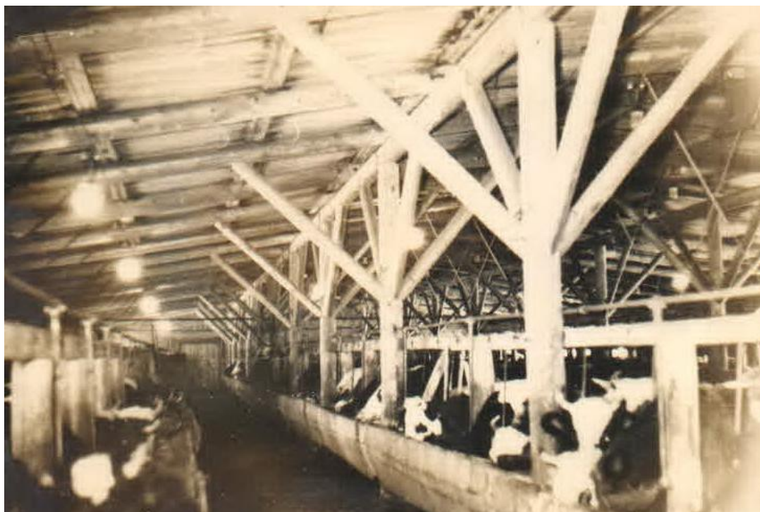
Фото 8. Молочнотоварная ферма (МТФ), д.Колотово.