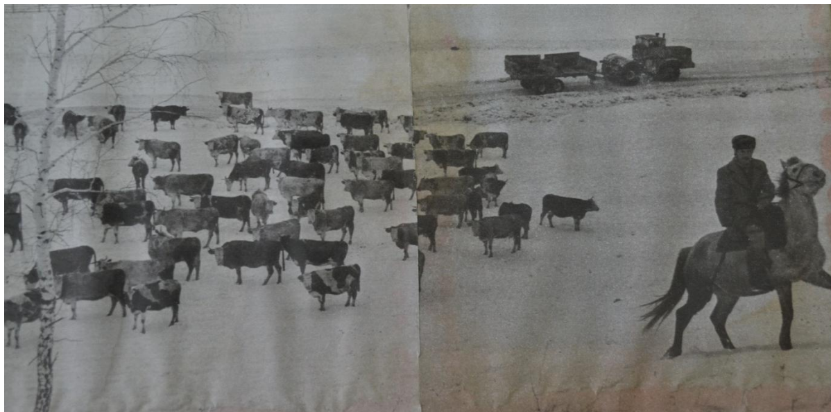
Фото 10. Зимний выгул дойного стада коров, Силинская МТФ.