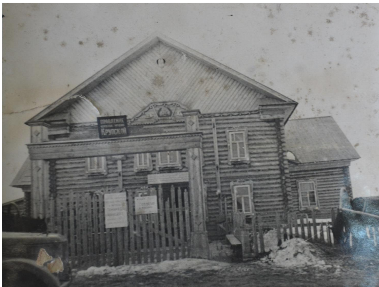
Фото 1. Здание правления колхоза им.Н.К.Крупской. 60-е годы.