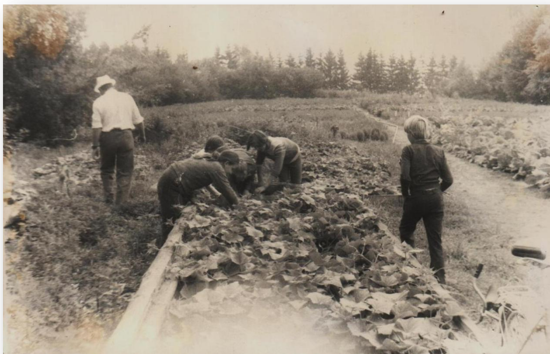
Фото 36. Летняя трудовая практика.

Овощи, выращиваемые на участке, шли на удешевление питания коллектива школы. Излишки реализовывались населению, учреждениям пгт Санчурск: больница, столовая РАЙПО, школа-интернат, профессиональное училище.