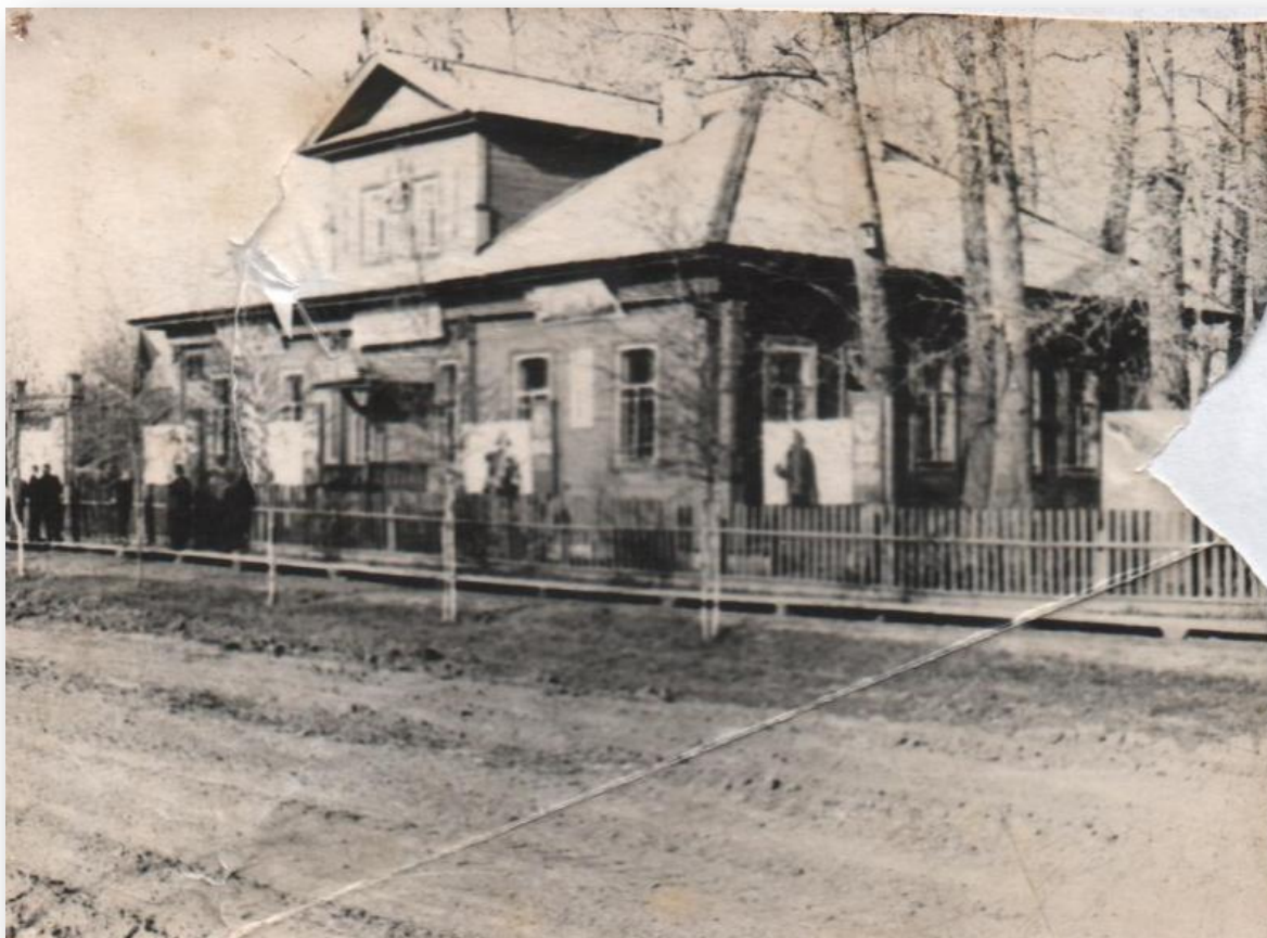
Фото 2. Здание деревянной школы семилетней Мельниковской школы