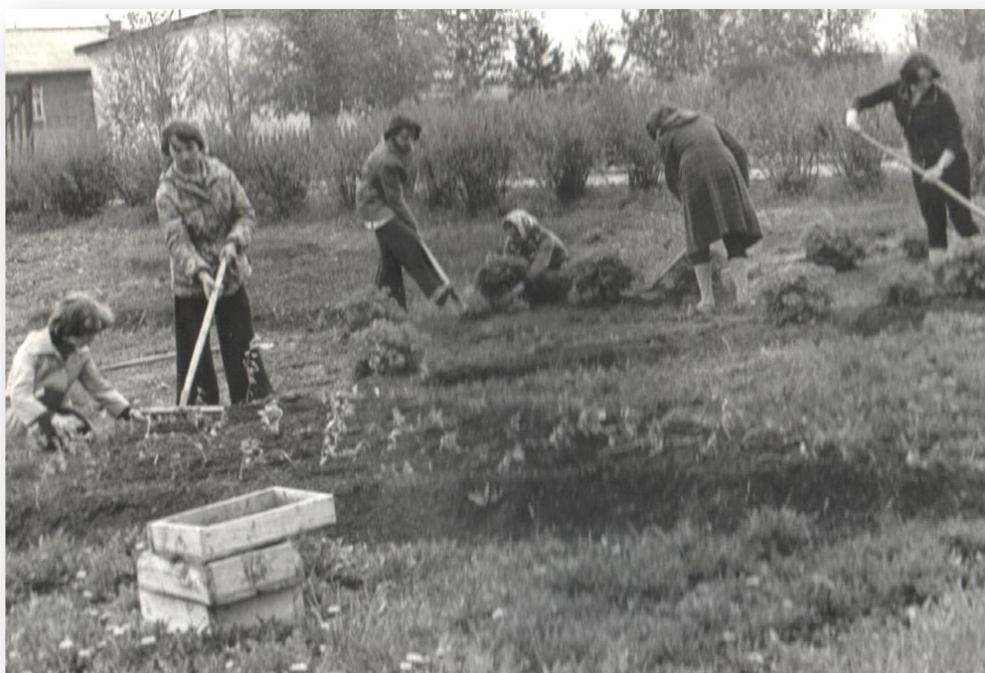
Фото 35. Весенние заботы.

В 80-е годы учебно-опытный участок имел отделы: плодово-ягодный (0,4 га.), овощной севооборот (0,15га.), полевой севооборот (72га.), парники (150 кв.м.), цветник (1500 кв.м.), коллекционный отдел (140 кв.м.).