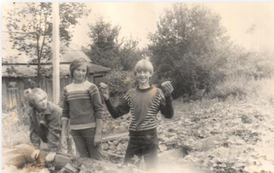
Фото 10. Сбор урожая огурцов.