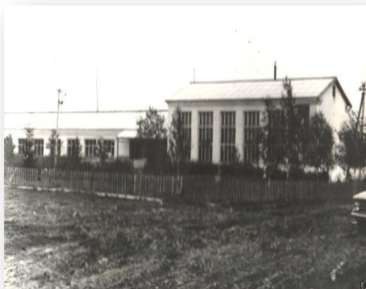
Фото 3. Здание новой школы.

Затем 1 сентября 1972 года школа перешла в новое типовое здание, в котором школа располагалась до 16 июня 2008 года.