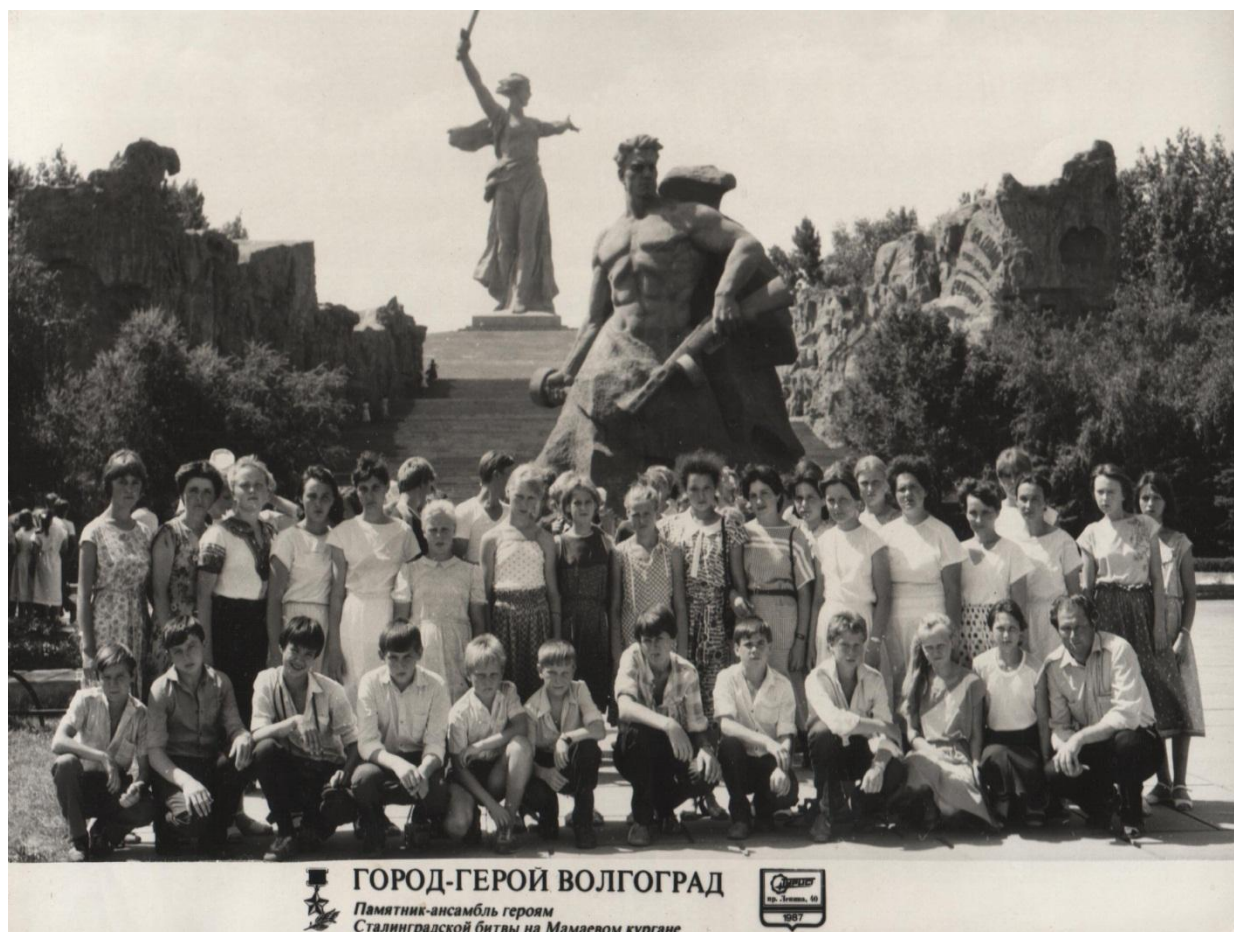
Фото 4. Поездки по городам-героя России.