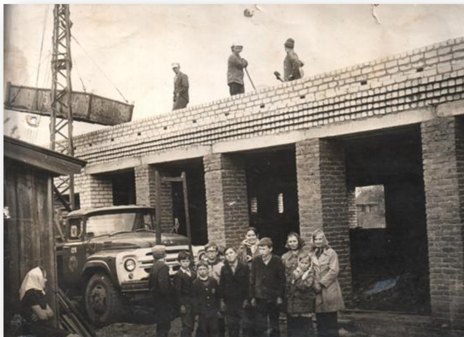
Фото 4. Строительство типового здания средней школы

Типовое здание школы и тир построены из кирпича, площадью 2260 м 2 . Отапливалось здание углем, дровами. Имеется земельный участок 500 м 2 .