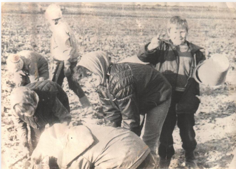
Фото 34. Школьники на уборке свеклы кормовой.

По итогам работы за 1988 год УПБ заняла первое место в Кировской области.