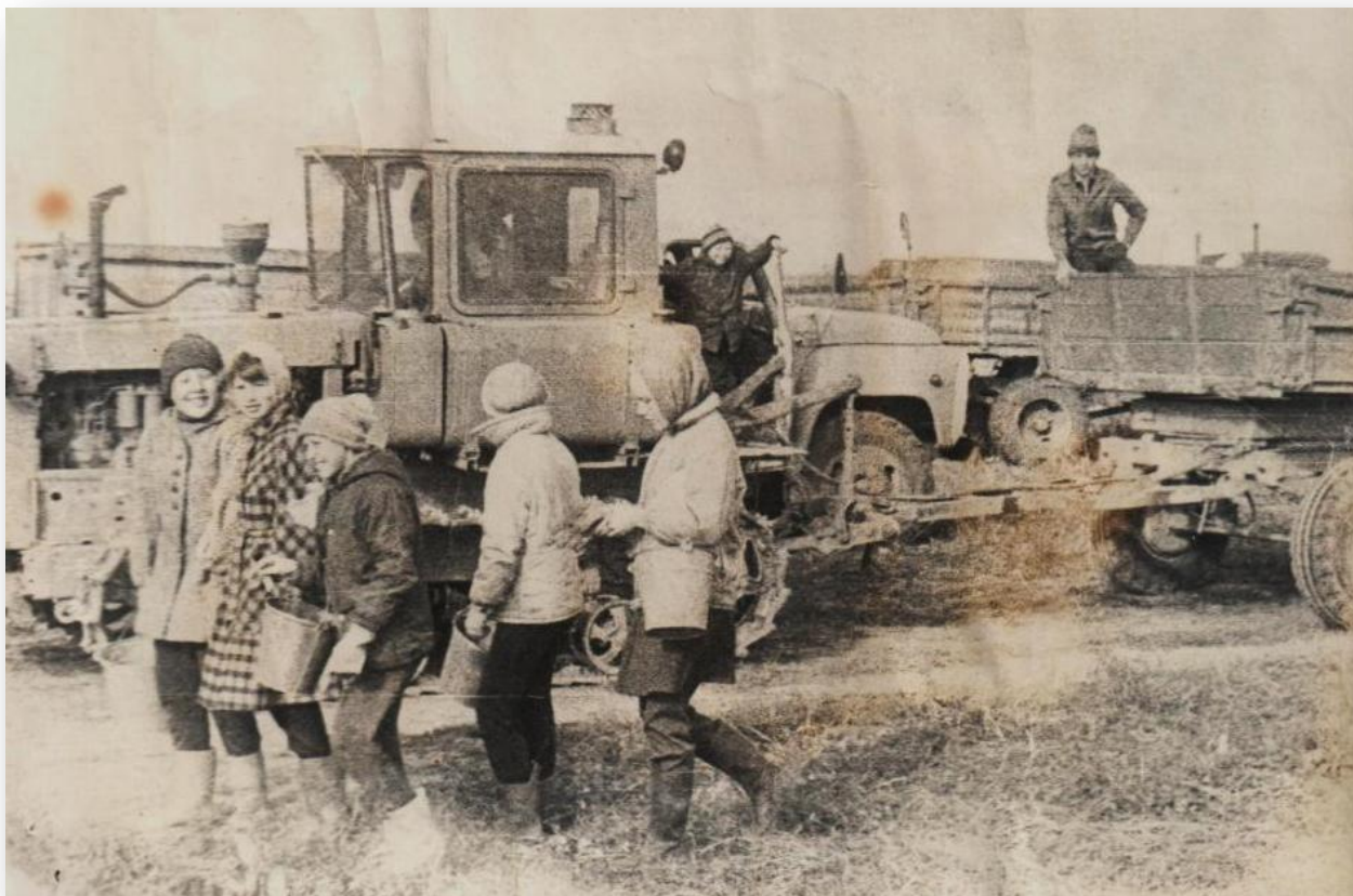
Фото 32. На уборке корнеплодов.

Эта мысль утвердилась после поездки на Белгородчину, где ученические производственные бригады давно уже выросли из коротких штанишек, где они стали высокорентабельными хозрасчетными подразделениями базовых хозяйств.