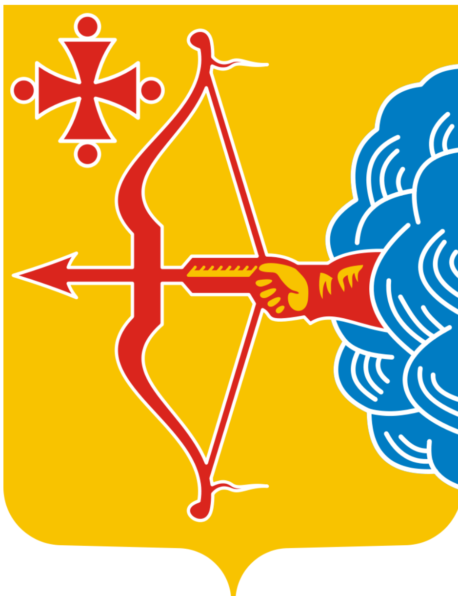
Рис. 1. Герб Кировской области. Дата принятия: 29.08.1995 Номер в Геральдическом регистре РФ: 190