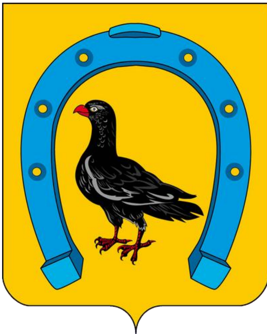
Рис. 2. Герб Санчурского района.