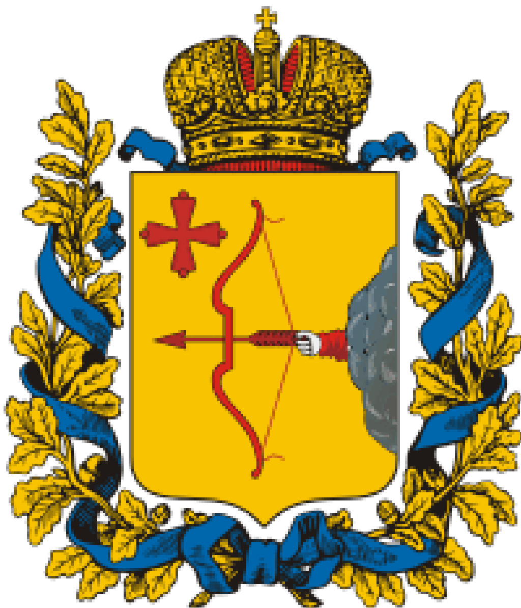
Рис. 3. Герб Вятской губернии. Дата принятия: 08.12.1856г.