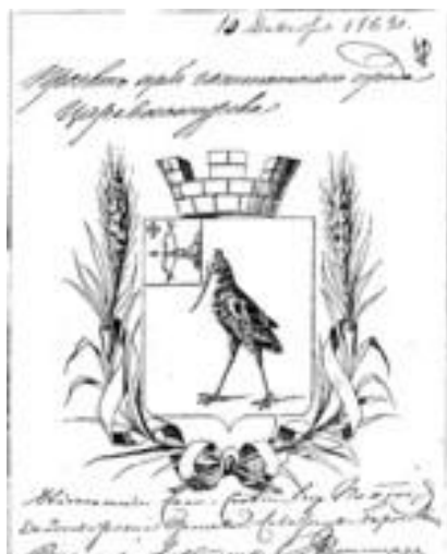
Фото 1. Проект Царевосанчурского герба. Рисунок датирован 1859 г.