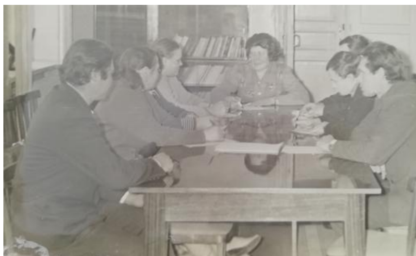
Фото 6. Сельскохозяйственная комиссия, 1977г.