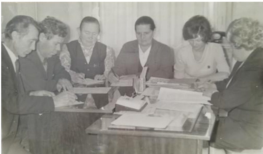
Фото 4. Комиссия по промышленности и строительству, 1977г.