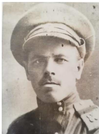
Фото 2. Народный комиссар Иван Семёнович Полозов