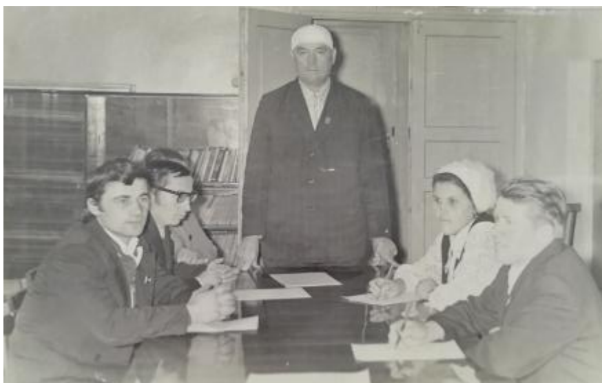
Фото 5. Комиссию по народному образованию, культуре, здравоохранению, 1977г.