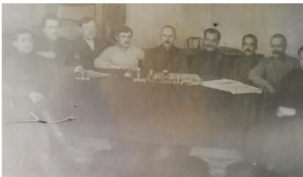
Фото 3. Уездный исполнительный комитет, 1918г.