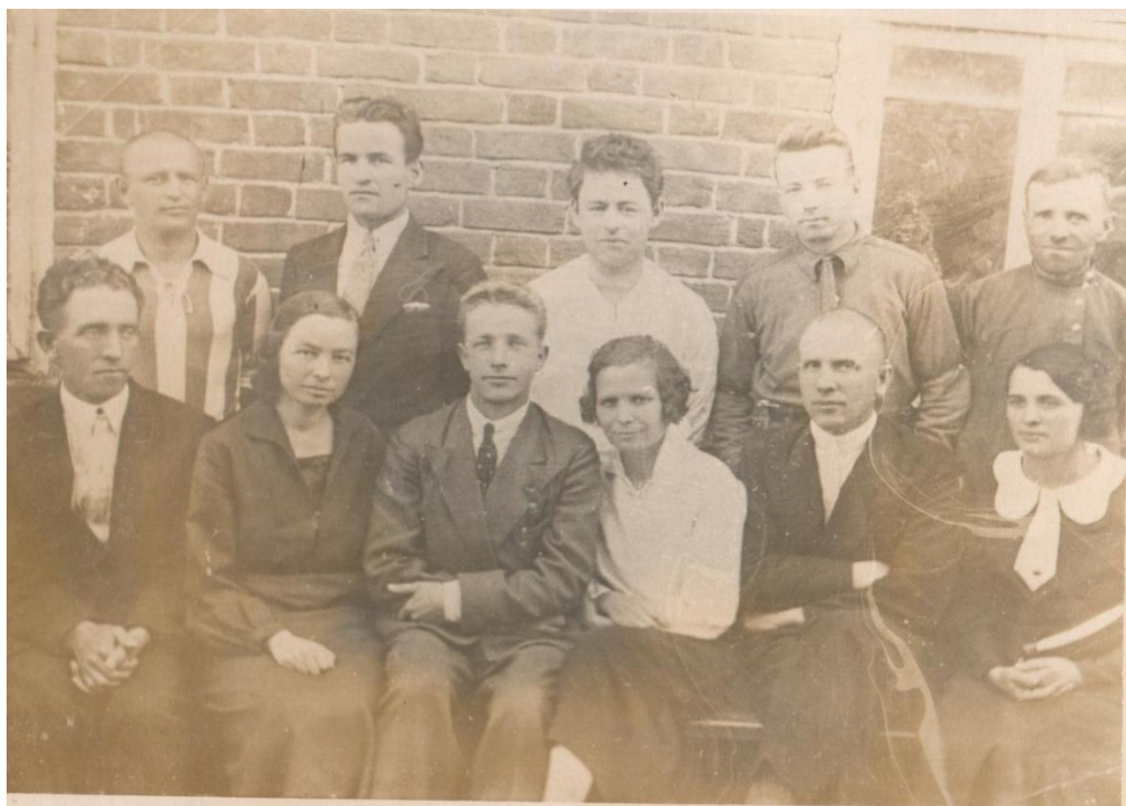
Фото 5. Коллектив учителей первого выпуска учащихся Санчурской средней школы. 1937г.