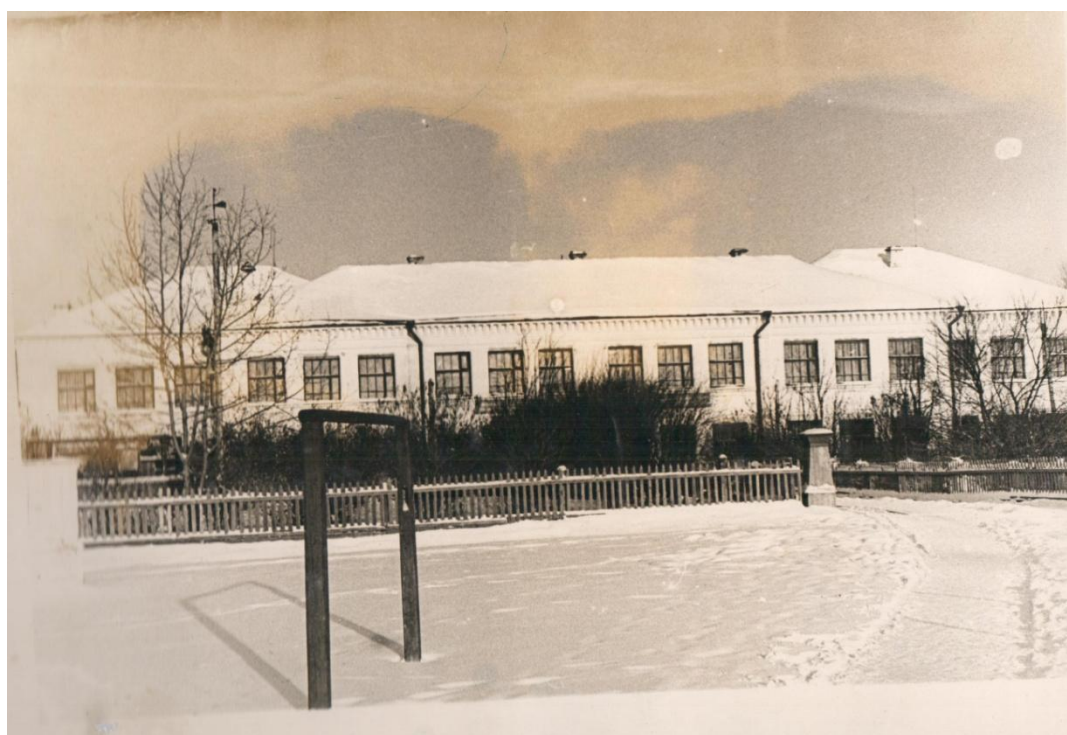
Фото 4. Здание школы №1. 1962г.