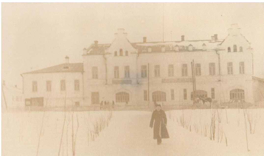
Фото 3. Одно из зданий школы (бывшая женская гимназия).