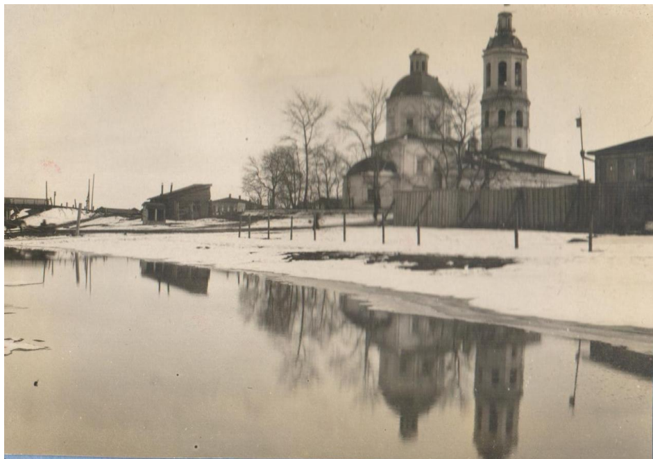
Фото 1. Разборка церкви. 1935г.