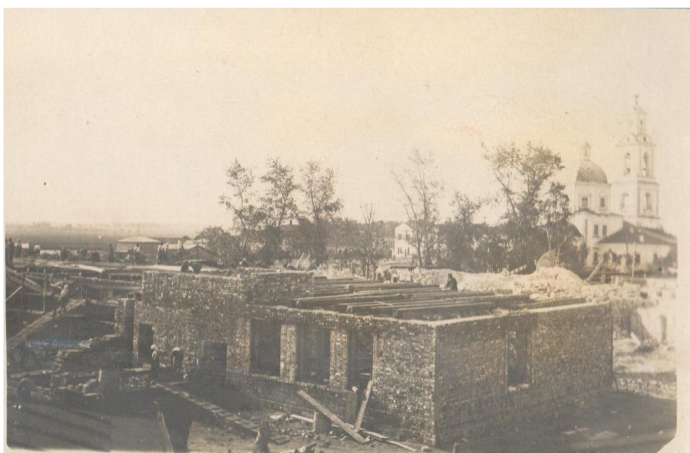
Фото 2. Начало строительных работ. 1936г.