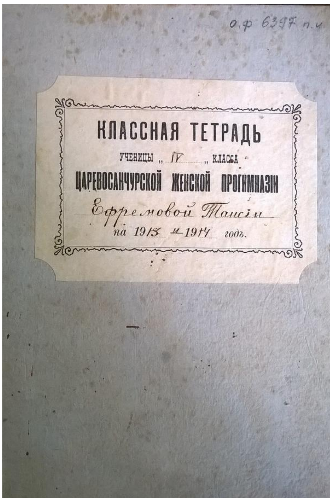
Фото 7. Классная тетрадь Ефремовой Таисии, ученицы 4 класса Царевосанчурской женской гимназии.