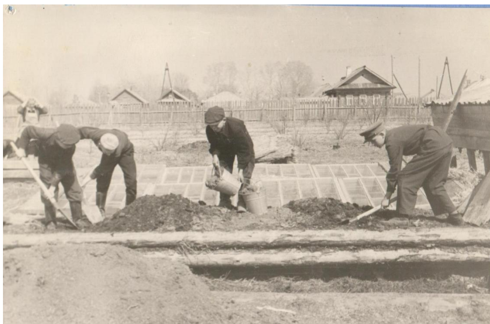
Фото 6. Прохождение весенне-летней сельскохозяйственной практике на земельном производственном участке.