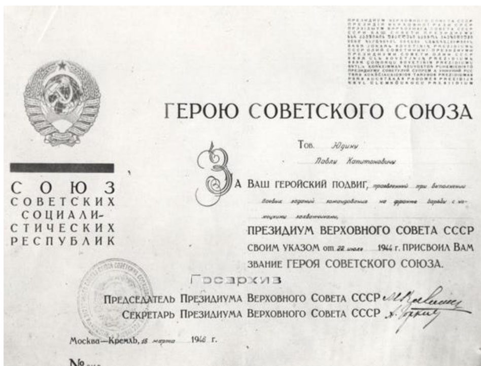
Фото 4. Фотокопия Указа Президиума Верховного Совета СССР от 22 июля 1944 г. о присвоении Юдину П.К. звания Героя Советского Союза за геройский подвиг, проявленный при выполнении боевых действий командования на фронте борьбы с немецкими захватчиками. 18 марта 1946 г. БУ «ГАСИ ЧР». Ф.Р-2900. Оп.9. Д.1. Л.1.