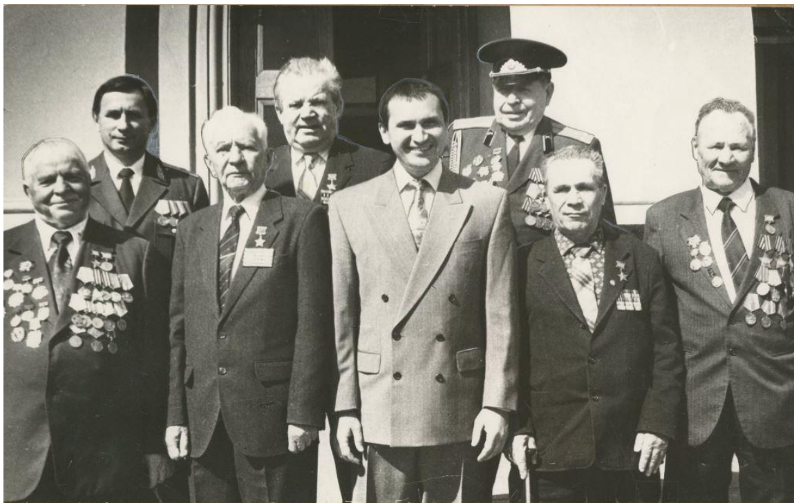
Фото 8. П.К. Юдин (второй ряд, второй слева) во время встречи Героев Советского Союза, полных кавалеров ордена Славы с Президентом Чувашии Н.В. Федоровым. 07 мая 1996 г.